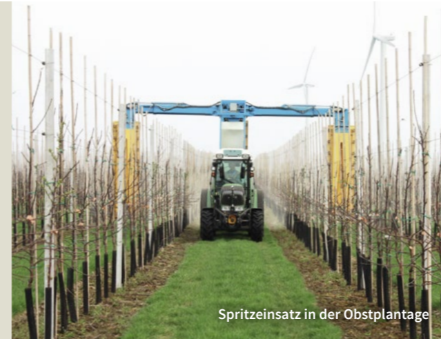
Spritzeinsatz in der Obstplantage

Ziel: Lebensräume erhalten, Flora und Fauna schonen, Gewässerbelastung minimieren