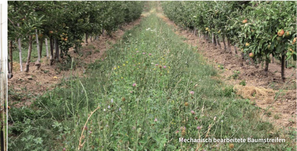
Mechanisch bearbeitete Baumstreifen