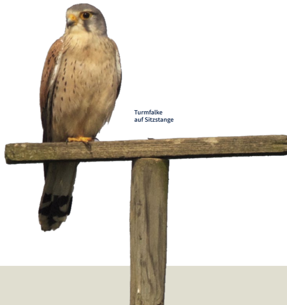
Turmfalke auf Sitzstange